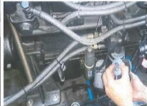
引擎回油管及洩壓閥安裝完成 (商業)