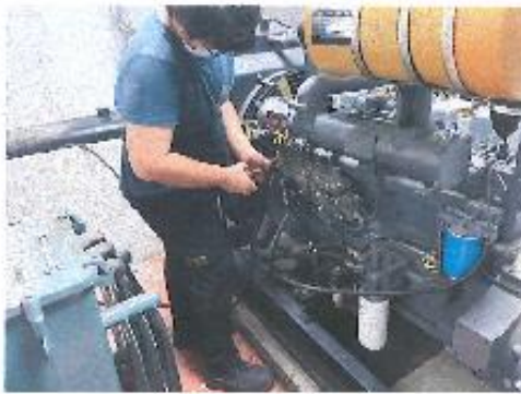
引擎回油管及洩壓閥安裝施工中 (商業)