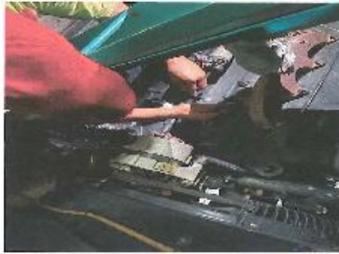
發電機組機油壓力開關更換施工中 (大同)