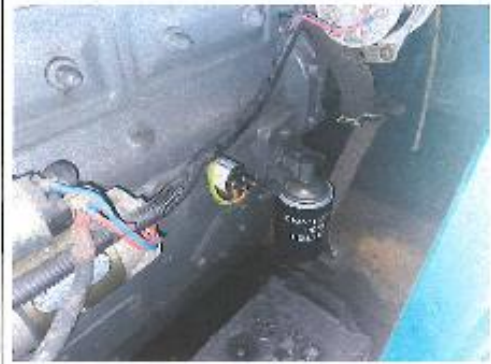
發電機組機油壓力開關更換完成 (大同)