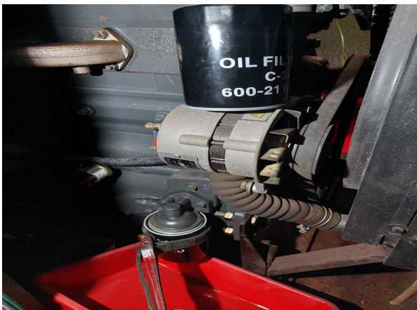
柴油濾清器更換施工