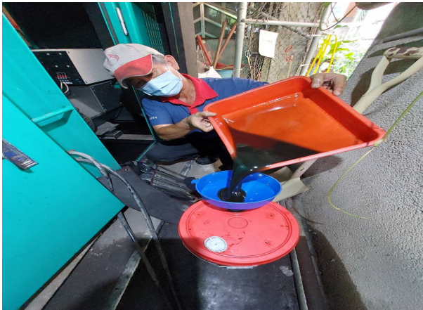
發電機引擎廢機油洩漏