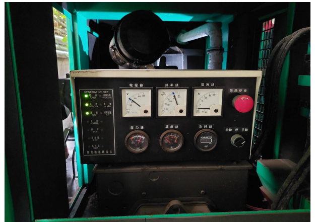
發電機組試運轉無異常