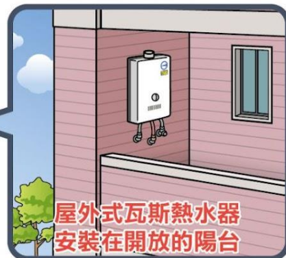
屋外式瓦斯熱水器 安裝在開放的陽台