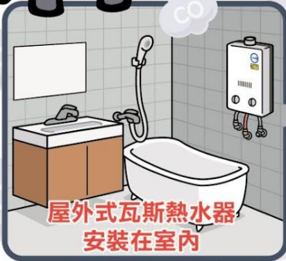
屋外式瓦斯熱水器 安裝在室內