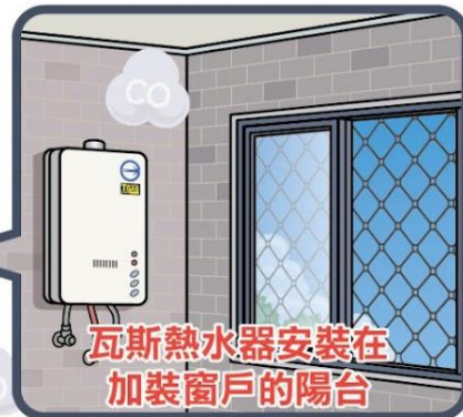
瓦斯熱水器安裝在 加裝窗戶的陽台