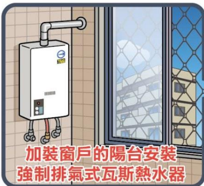
加裝窗戶的陽台安裝 強制排氣式瓦斯熱水器