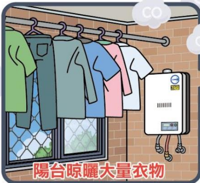
陽台晾曬大量衣物