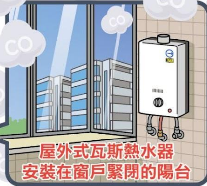
屋外式瓦斯熱水器 安裝在窗戶緊閉的陽台