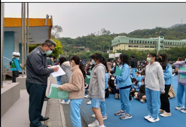
教官簽名學生是否全部到齊和安全