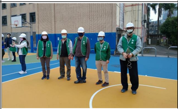
安全防護組預備就緒協助學生 是否安全和被保護