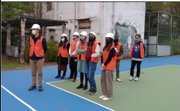
避難引導組預備就緒待派引導學生掩護