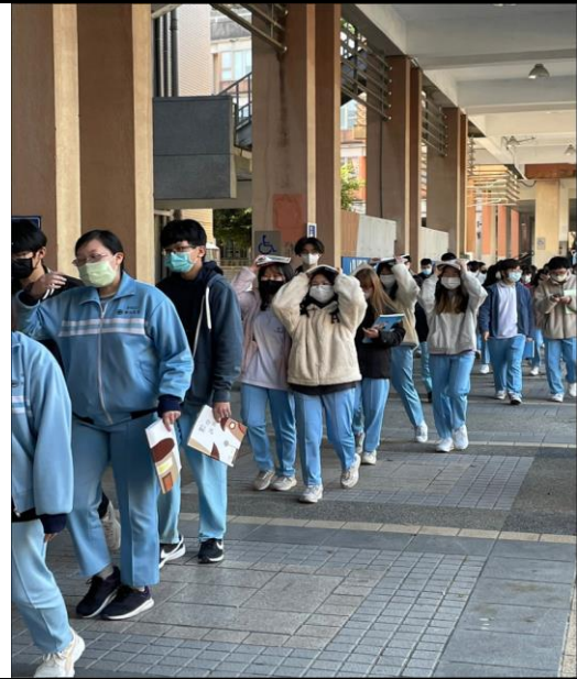
學生速行掩護至操場集合。