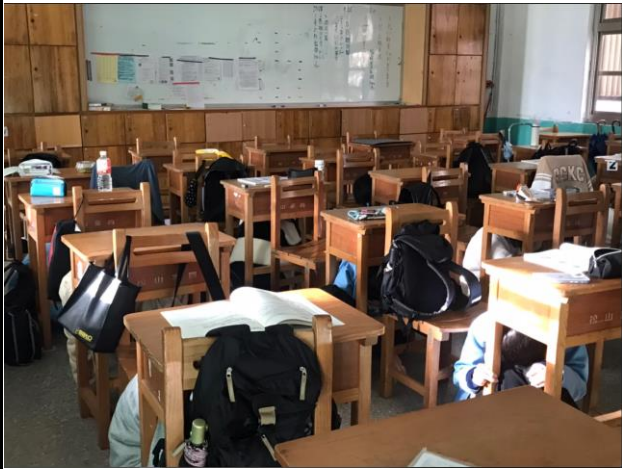
學生演練掩護頭部等重要部位。