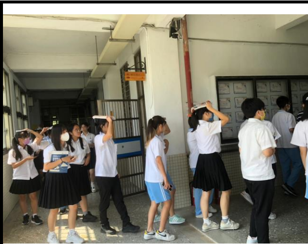
廣設大樓的學生拿書籍掩護重要的頭部