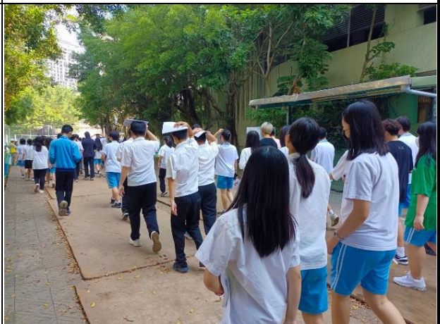
經營大樓的師生一路緩緩的走至操場集合