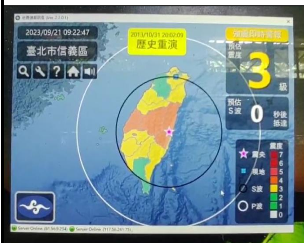
9 月 21 日 9 點 21 分正式發布防震警報