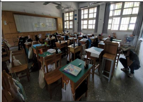
師生一併演練趴下、掩護、穩住