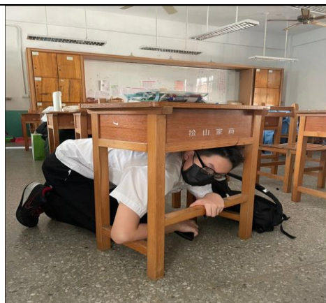
學生趴在桌下、掩護其身及穩住桌腳保護全身安全