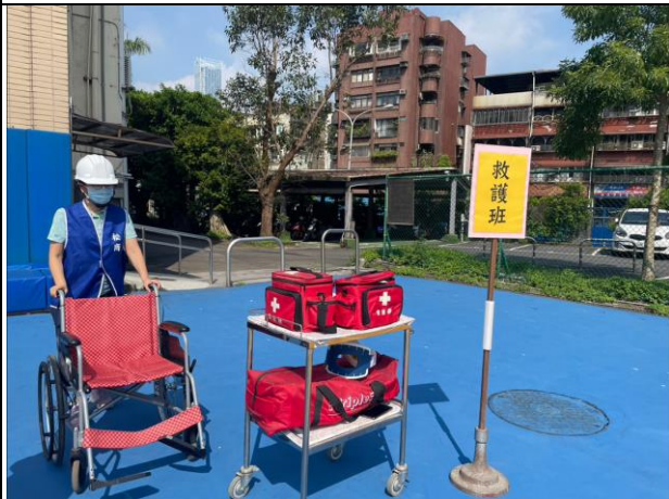
救護組準備就緒的急救用具待支援受傷的學生