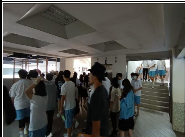
綜合大樓擁擠的樓梯間「不語、不跑、不擁擠」