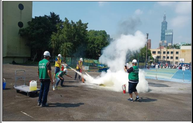
搶救組撲滅火災演練