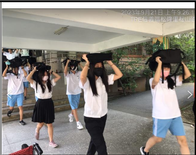
也用書包掩護頭部前往操場集合