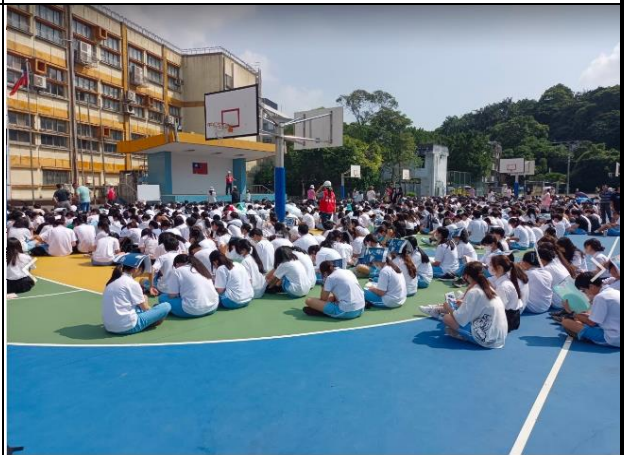
會議檢討並加強防災觀念與注意事項