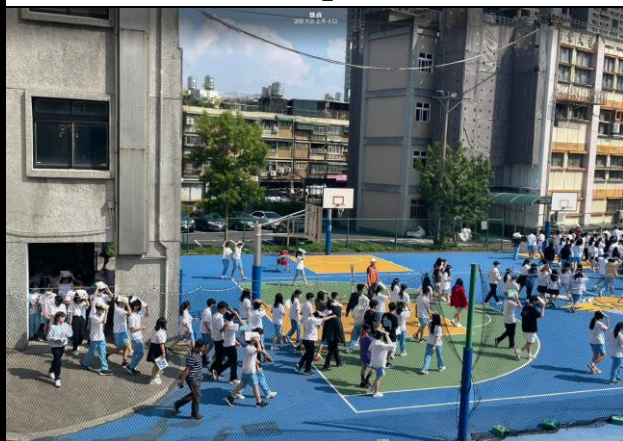
自強樓的師生疏散至操場集合演練