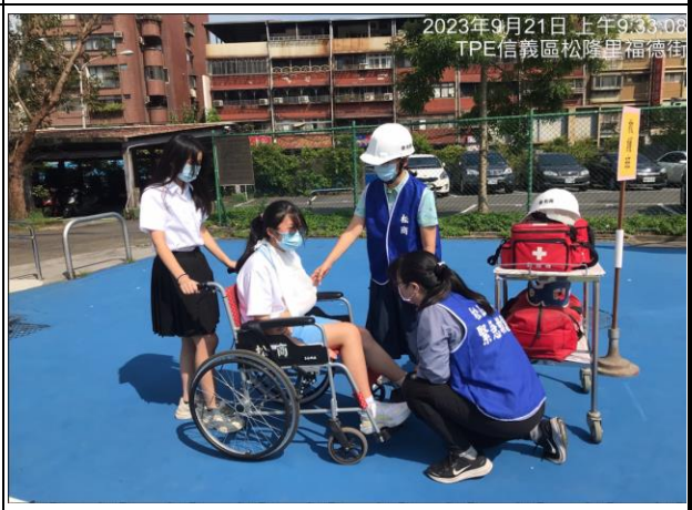
緊急救護組演練處理受傷學生