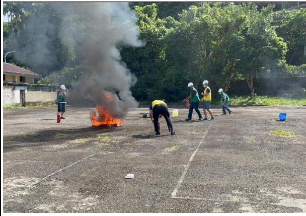
火災發生緊急搶救