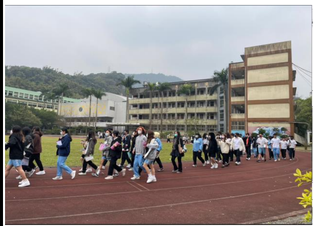
學生速行掩護至操場集合。