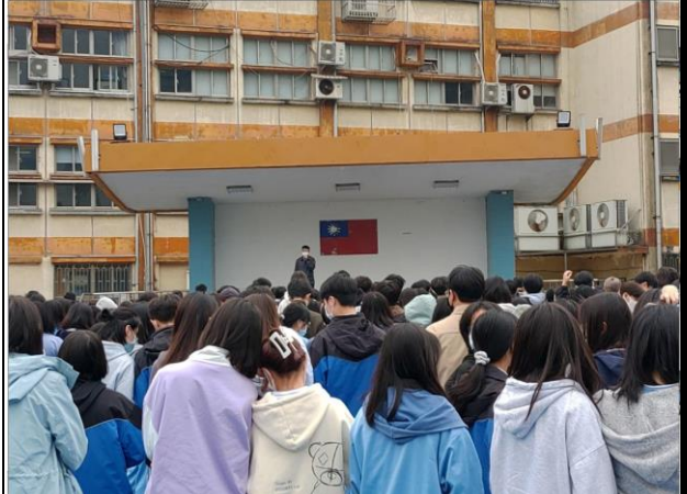
教官主持會議檢討並加強防災觀念和注意事項