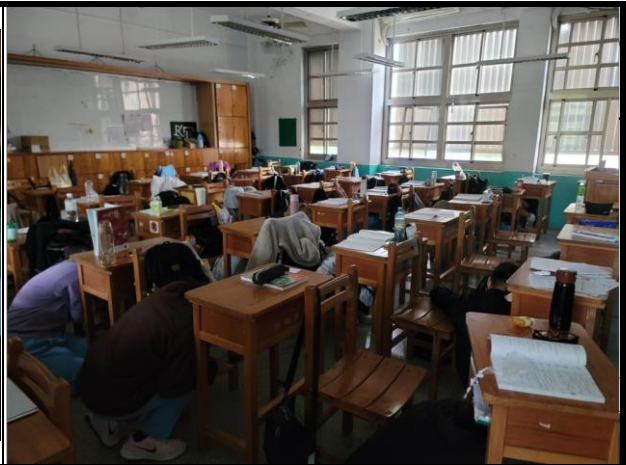
上課中的學生在桌下掩護。