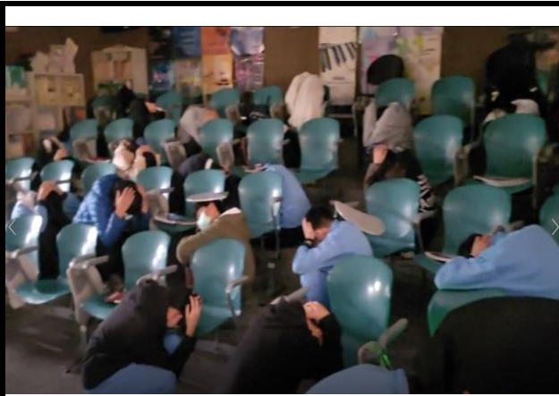
音樂教室上課中，忽然發出震訊，學生放下音樂器材，找地方掩護頭部等重要部位。