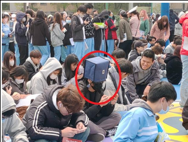
學生用保暖袋子掩護重要頭部