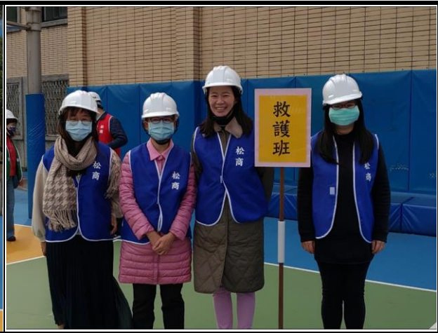
啟動防災編組--緊急救護組