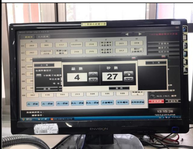
3月8日9點21分正式發布防震警報