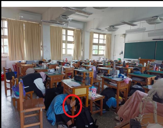
廣設大樓的學生握住桌腳保護全體安全