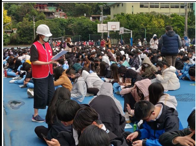
進行人員清查及安全回報