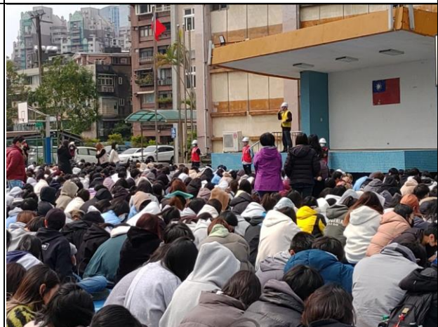
會議檢討並加強防災觀念與注意事項