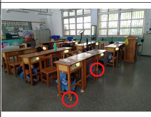
經營大樓--學生趴在桌下、掩護其身及穩住桌腳保護全身安全