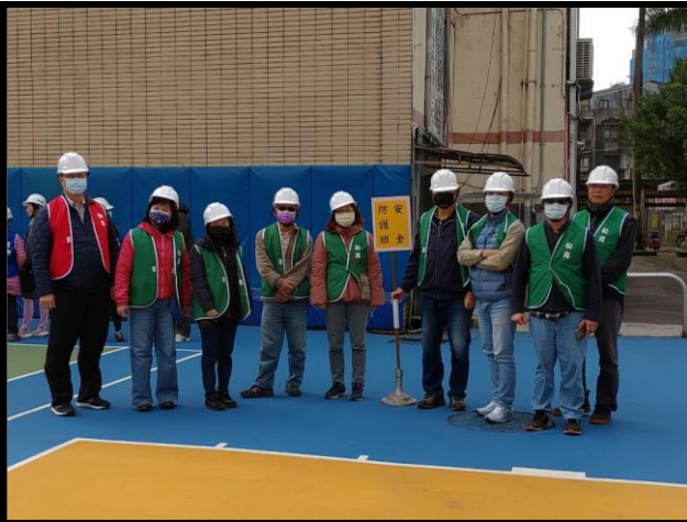
啟動防災編組--安全防護組