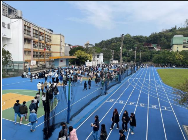
學生四方八面湧入操場集合