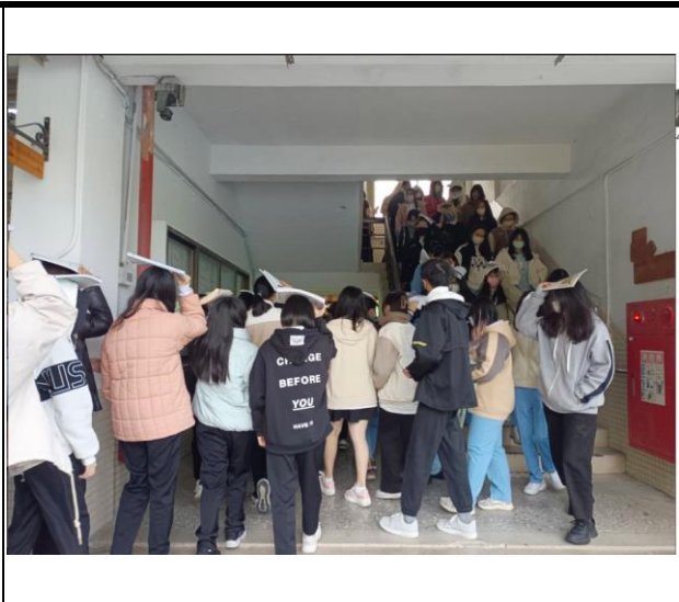
廣設大樓疏散進行進間做好「不語、不跑、不推」