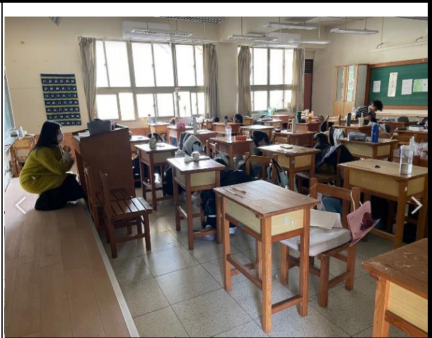
綜合大樓師生一起就地掩護演練