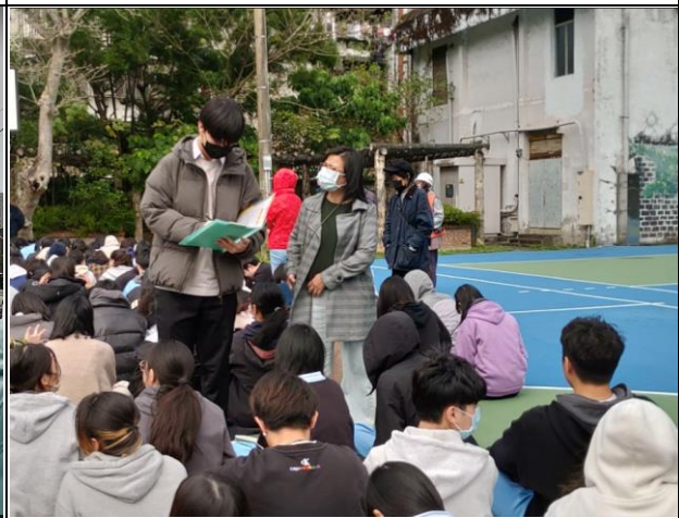
班級老師清查人數和關懷學生情緒