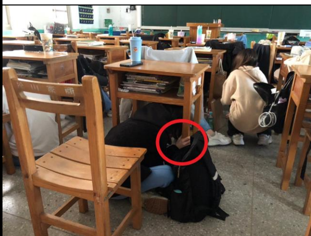
力行樓--學生趴在桌下掩護及穩住桌腳以保全身安全