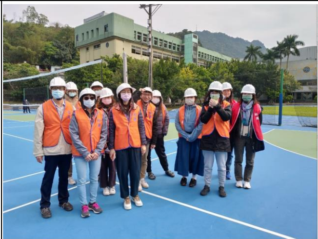
啟動防災編組--避難引導組