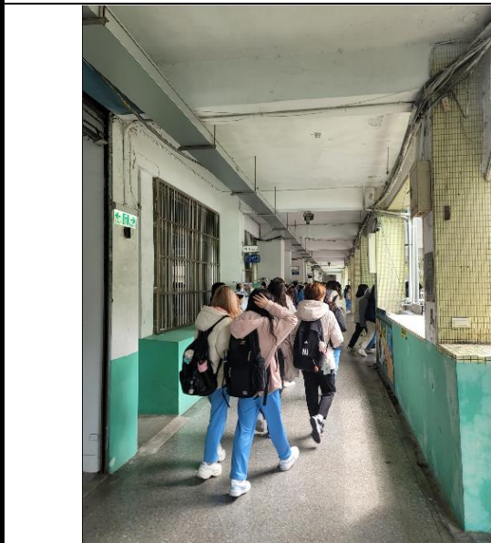
經營大樓學生往操場集合