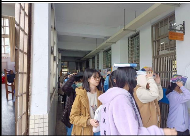
廣設大樓學生速行疏散往操場集合