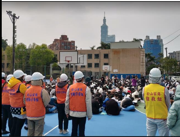
搶救組和避難引導組在學生旁邊待命支援