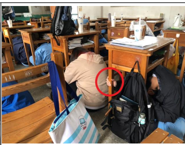
抗震保命三步驟--趴下、掩護、握住