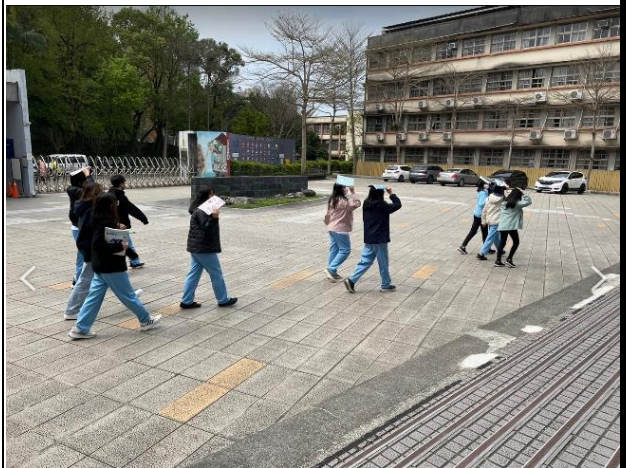
綜合大樓學生用書包掩護頭部前往操場集合