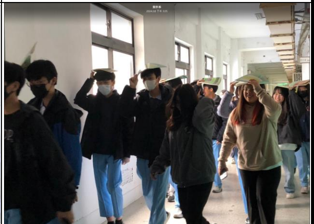
力行樓的學生拿書籍掩護重要的頭部